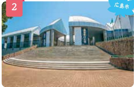
広島市現代美術館

日本プロ野球唯一の市民球場として地元市民に愛される、広島東洋カープの本拠地「Mazda Zoom-Zoom スタジアム広島(マツダスタジアム)」は2009年3月にオープンしました。試合が開催されていないときでも球場に自由に入場できる一般開場日があり、プロ野球ファン以外も楽しめるスタジアムです。