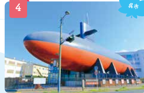
海上自衛隊呉史料館(愛称:てつのかじら館)

世界遺産・厳島神社から徒歩5分の場所に位置する宮島水族館は、景観に配慮した和風建築の水族館です。「いやし」と「ふれあい」をコンセプトに、瀬戸内海の生き物を中心に、350種13,000匹以上が観光客の目を楽しませています。瀬戸内のくじらと呼ばれる希少生物スナメリは癒されると大人気です。