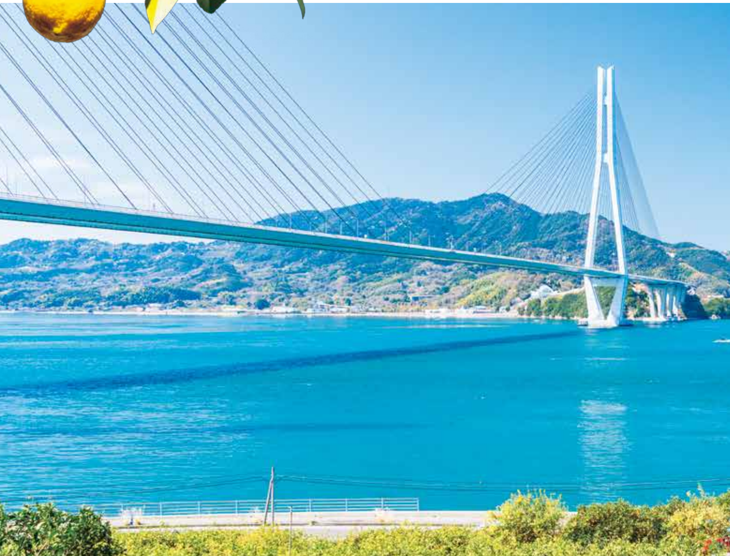
〈尾道市〉多々羅大橋