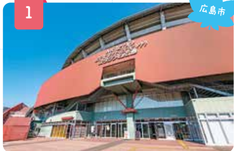
MAZDA Zoom-Zoom スタジアム広島 (マツダスタジアム)

カープファンの聖地・マツダスタジアムから、 風光明媚な大自然まで、「行きたい!」「見たい!」が いっぱい、広島の名所をご紹介します。