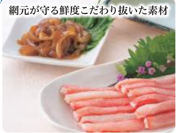
網元が守る鮮度こだわり抜いた素材

山陰の海が育む、 紅のごちそう 境港は日本有数の紅ズワイガニの水揚げ港で、 その漁獲量は全国トップクラスを誇ります。 日本の深海で育った紅ズワイガニは、みずみずしく繊細な甘みの特徴。 身はやわらかくジューシーで、噛むほどに濃厚な旨みが広がります。