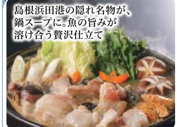
島根浜田港の隠れ名物が、鍋スープに。魚の旨みが溶け合う贅沢仕立て

天然の本アンコウ(キアンコウ)は、あっさりとした身で食べやすいのが特徴です。同封の味噌スープとの相性がよく、お好みの野菜と煮込んでお楽しみください。