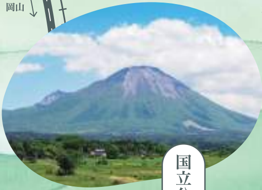
国立公園 大山 西伯郡 大山町

中国地方最高峰の大山は古くから神仏の住む山として知られ、豊かな自然が残されています。中腹のブナ林は西日本最大級で蓄えられた良質な水が麓を潤します。周辺では敬意を込めて「大山さん」と呼んでいます。