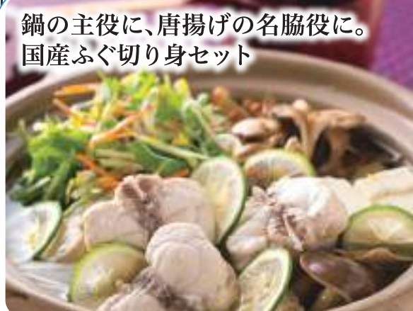
鍋の主役に、唐揚げの名脇役に。国産ふぐ切り身セット

国産フグの切り身です。同封している魚介醤油ベースの鍋の素で煮込んでお召し上がりください。みずみずしい食感のフグは、唐揚げにしても絶品です。