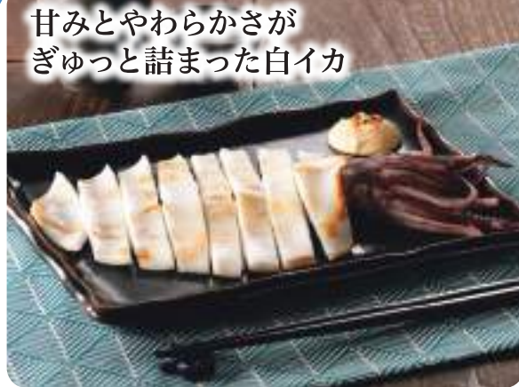
甘みとやわらかさがぎゅっと詰まった白イカ

山陰名産剣先イカ(白イカ)を丁寧に塩干しました。甘くて柔らかな身が特徴で、お客様からご年配の方まで人気があります。