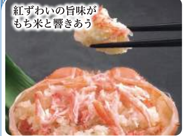
紅ずわいの旨味が もち米と響きあう

●商品内容/いか醤油漬150g×4、紅ズワイガニ棒肉80g×3 ●賞味期間/冷凍180日