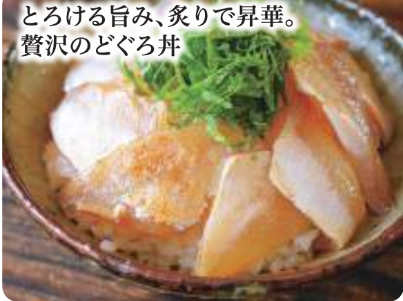
とろける旨み、炙りで昇華。贅沢のどぐろ丼

「白身のトロ」と称されるほどとろけて、旨味の濃い「のどぐろ」。炙ることでよりジューシーに。その後丸大豆醤油にじっくり漬け込みました。