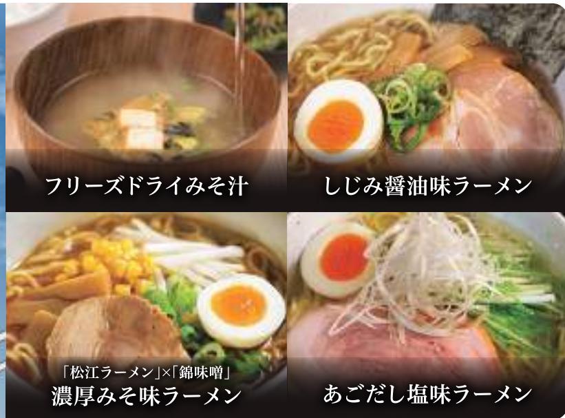
フリーズドライみそ汁