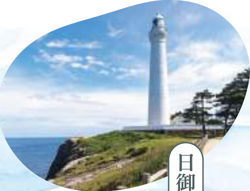
日御碕灯台 出雲市

島根半島最西端の断崖に立つ出雲日御碕灯台は、明治36年に設置されました。白壁とレンガの二重構造で、石造灯台として日本一の高さを誇ります。光度48万カンデラで夜間40キロメートル先まで照らし、今も海の安全を守っています。