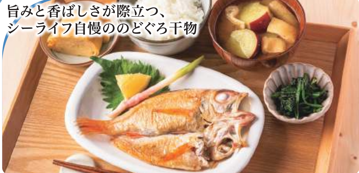
旨みと香ばしさが際立つ、シーライフ自慢ののどぐろ干物