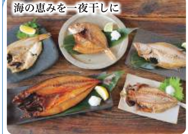
海の恵みを一夜干しに

一枚一枚丁寧に下処理を行ったのどぐろ、あじ、サバ、エテカレイ、レンコダイの干物セットです。脂ののった魚を丁寧に干すことで旨味が増し、食が進むお品です。